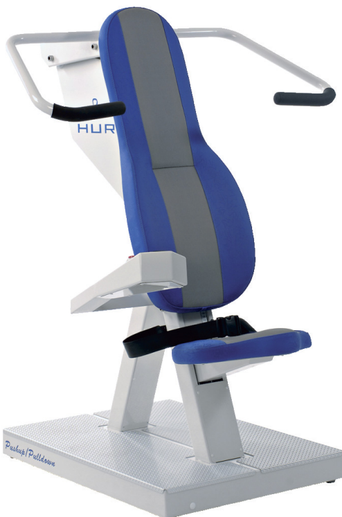
Produkt-Nr.: 5120 Breite: 110 cm, Länge: 120 cm, Höhe: 140 cm, Gewicht: 70 kg