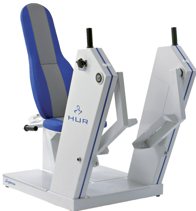
Produkt-Nr.: 5540 Breite: 85 cm, Länge: 145 cm, Höhe: 135 cm, Gewicht: 110 kg